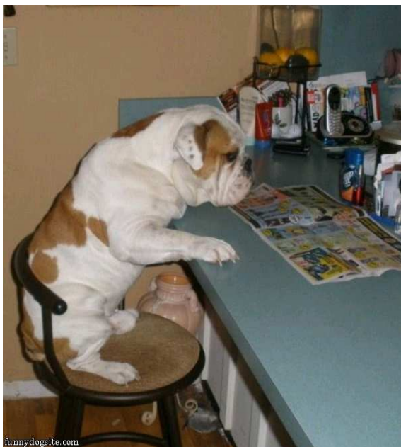
Colectivul de redacție.